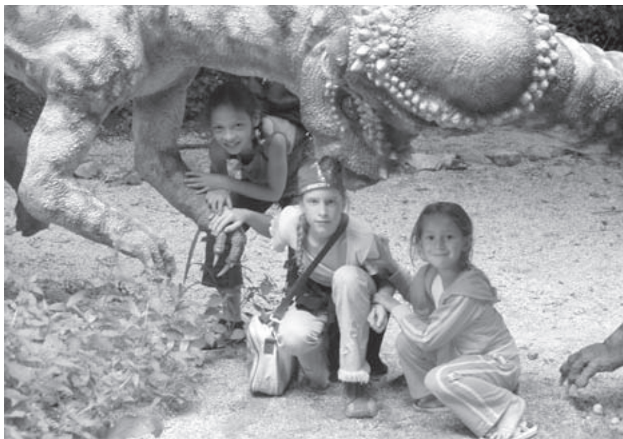
Deti MIXklubu na výlete v ZOO.