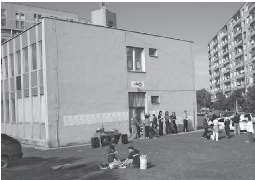
MIXklub v bratislavskej mestskej časti Vrakuňa.